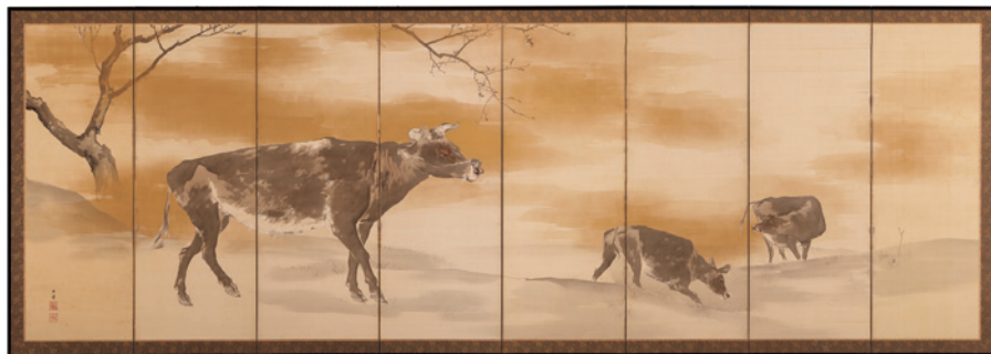
作品画像（裏面）：岸竹堂『牛馬図』明治時代

連なった複数のパネルを折り曲げて自立する屏風。その形状を念頭に描かれているため、平面の絵画とは異なる楽しみがあります。本展では斜めの角度から見たり、歩きながら見たり、はたまた折っていない状態と比較するなど、それぞれの作品をおすすめの鑑賞方法とともにご紹介します。様々な視点で屏風をためつすがめつご覧ください。